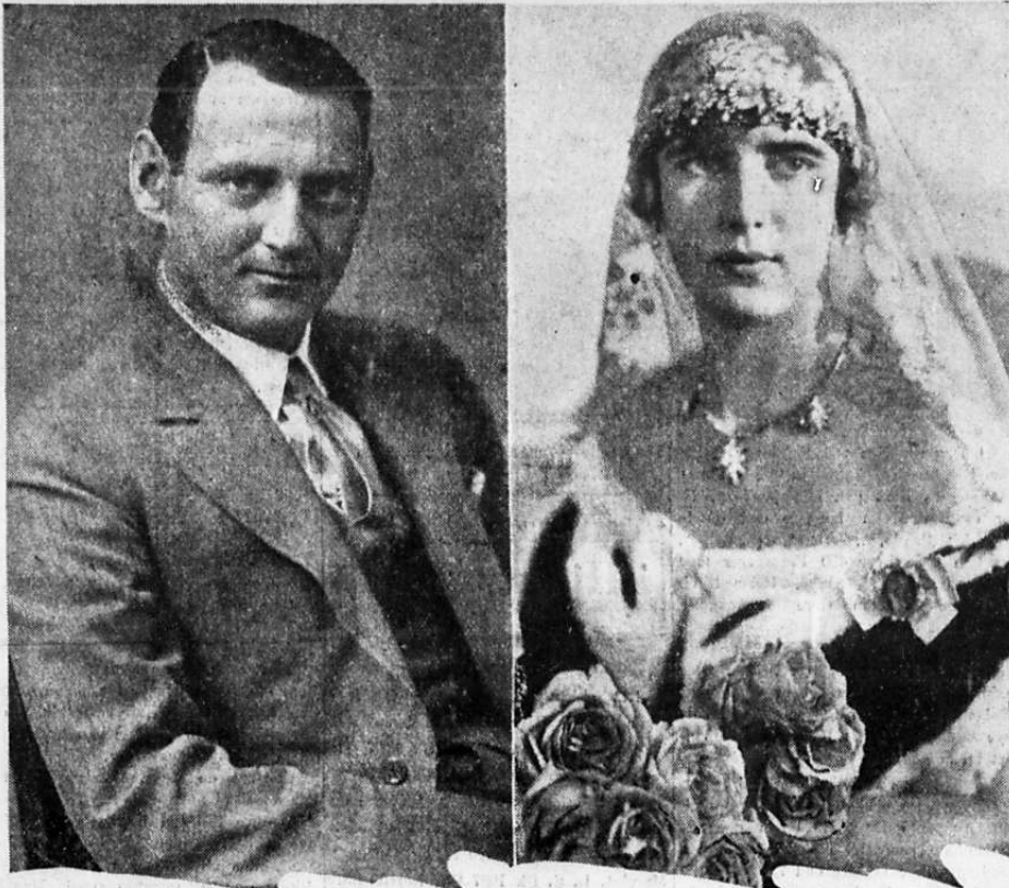
De nyeste Billeder af Kronprins Frederik og Prinsesse Ingrid.

Kronprinsen afrejste i Aftes sammen med Dronningen til Stockholm og umiddelbart efter Ankomsten bliver Forlovelsen meddelt officielt — Bryllupet finder Sted om et Par Maaneder